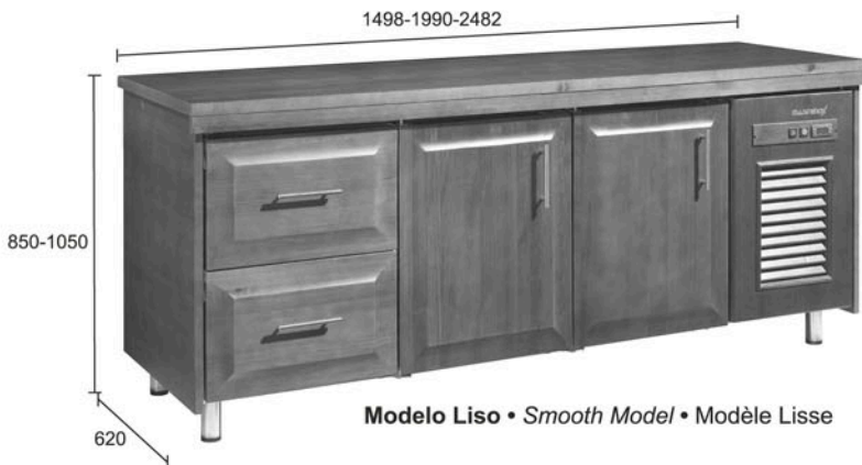
Modelo Liso • Smooth Model • Modèle Lisse